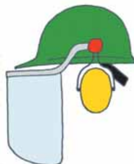
Eksempel på et kombiværn

Hvis øjenværnet skal bruges sammen med hoved-, høre- eller åndedrætsværn, må den samlede beskyttelse ikke forringes. Vær især opmærksom på, at stængerne på brillestel ofte giver problemer i forbindelse med høreværn af kop-typen. Der kan i disse tilfælde ofte med fordel anvendes et "kombiværn" – se illustrationen nedenfor.